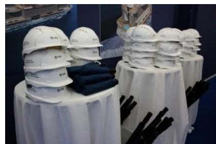
Z loděnice Fincantieri-Monfalcone